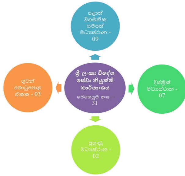
රූපසටහන 1.2 - ශ්‍රී ලංකා විදේශ සේවා නියුක්ති කාර්යාංශයේ ව්‍යුහය