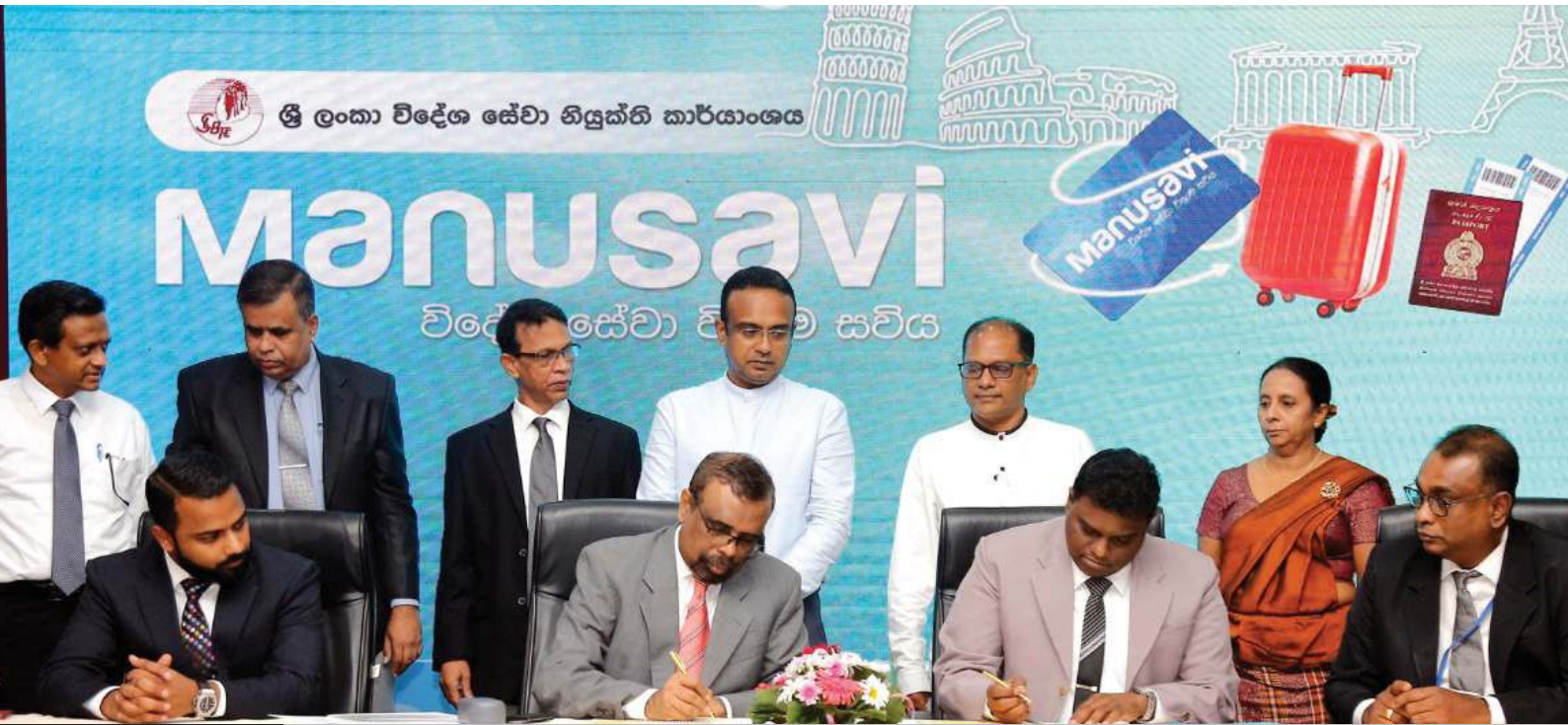
ඡායාරූපය 5.1 විගමනික දායකත්ව විශ්‍රාම වැඩසටහන